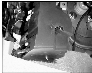
Electric Junction Box Underneath Dashboard

Boîte de jonction Sous le tableau de bord