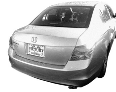
Honda Accord 4 Door Sedan Honda Accord Sedan