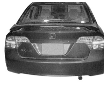
Honda Civic 4 Door