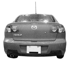
Mazda 3 (All Models)